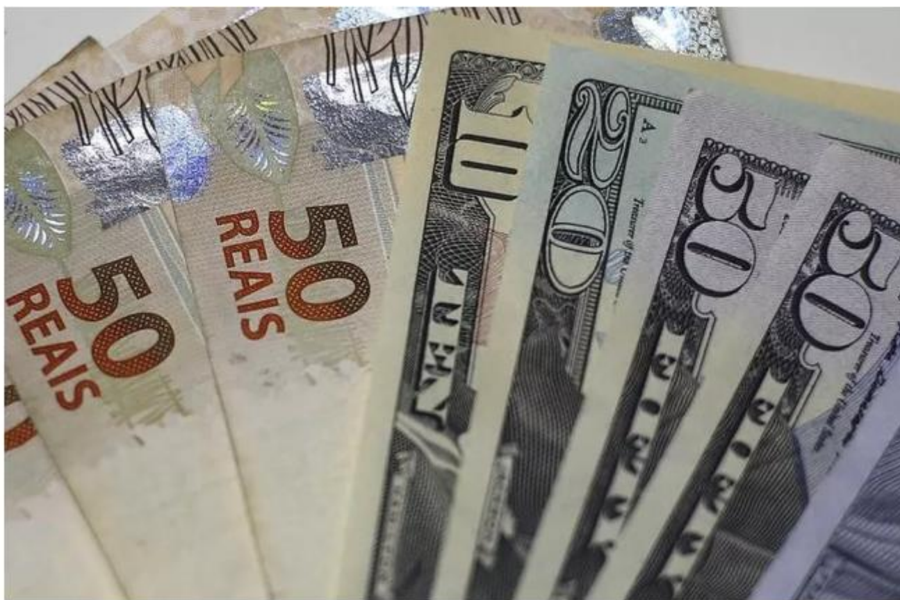
Notas de dólar e real em casa de câmbio no Rio de Janeiro

O real é a quarta moeda que mais perdeu valor em relação ao dólar no mês de outubro, mostra um levantamento realizado pelo economista Alex Agostini, da Austin Rating .